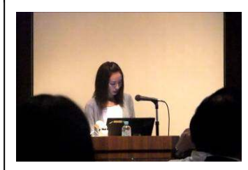
左縦上：ポスターセッション 左縦下：分科会発表の様子 中上：記念講演(宇都宮健児氏) 中中：分科会発表の様子 右上：参加者で記念写真