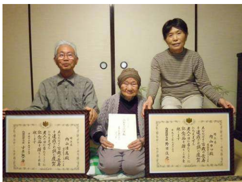
百歳を迎えて、総理大臣から感謝状をいただきました。息子さんご夫婦とご一緒に

しかし、「ふたりにて二百歳」の内山ご夫妻は、それ自体が、文句なしに幸運であり、幸いなことです。こんな貴重なカップルをお創りになるとは、神様、実に不平等。でも、とても高嶺ですが素晴らしい目標を、我々にお与えになった。