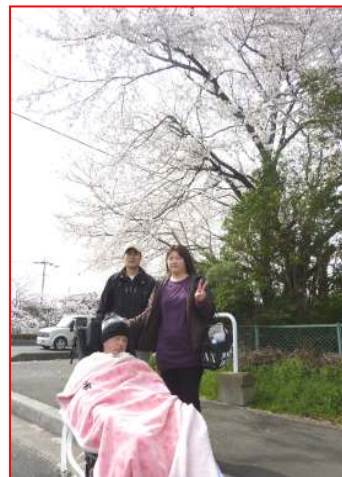
家族などと桜を満喫する