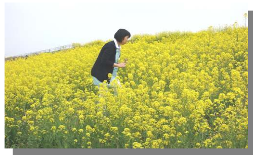
毎日外の景色に見とれます。見とれすぎて寄り道をしてしまいます。

また、今は床ずれが治らず苦勞している利用者さんが二人います。療養環境の見直し、ケア方法の検討をしながら対応しています。