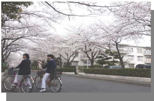
桜が満開の中を自転車で利用者さん宅へと向かいます。

三郷在住の看護師3名で、自転車や自動車で訪問しています。主治医のクリニックが1階にあるため、利用者さんのことは毎日主治医とクリニックナースとで相談しています。まだまだ利用者さんがたくさんいらっしゃるわけではありませんが、これから徐々に増えてくると思われます。先日はご自宅での看取りがあり、毎日欠かさず訪問していたので、みんなで最期のケアを行いました。ご家族、ご本人が望んだように家で最期まで過ごすことができ、本当に良かったとご家族の方々もおっしゃっていました。そして、ご家族のもつ「 看護の力 」を実感しました。