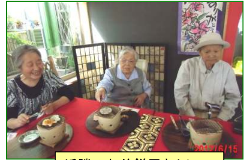
近隣のお前餅屋さんにて

また近隣の高齢者の方と共に「みさと花火大会」を楽しんだり、地域の方に出展して頂く「作品展」を開催する事で地域の人々との関係を深めて参りました。地元の丹後小学校や地区の運動会に誘って頂き、高齢者が参加出来るように配慮して下さり、盛り上げて下さるなど御協力して頂く事で楽しい時間を作る事もできました。