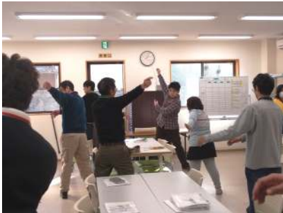
体操は、一日の始まり

2013年3月1日、就労移行支援事業所ラ・ポルタは1周年を迎えました。利用者の皆さんとともにお茶とケーキで1周年をささやかにお祝いしました。