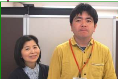
二人仲良く ハイ パチッ!

障がいを持つ息子が、ラ・ポルタを利用させていただき一年が経っています。10数年の間、一般企業で働いてきた息子にとっては、働く事を小休止し、自分を知る時間であり、親の私にとっては、改めて息子の障がいとは何か。生きにくさは？ また、健常な部分は健全に育っているのか、改めて点検する機会になっています。