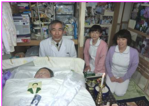
亡くなられたSさんと一緒に